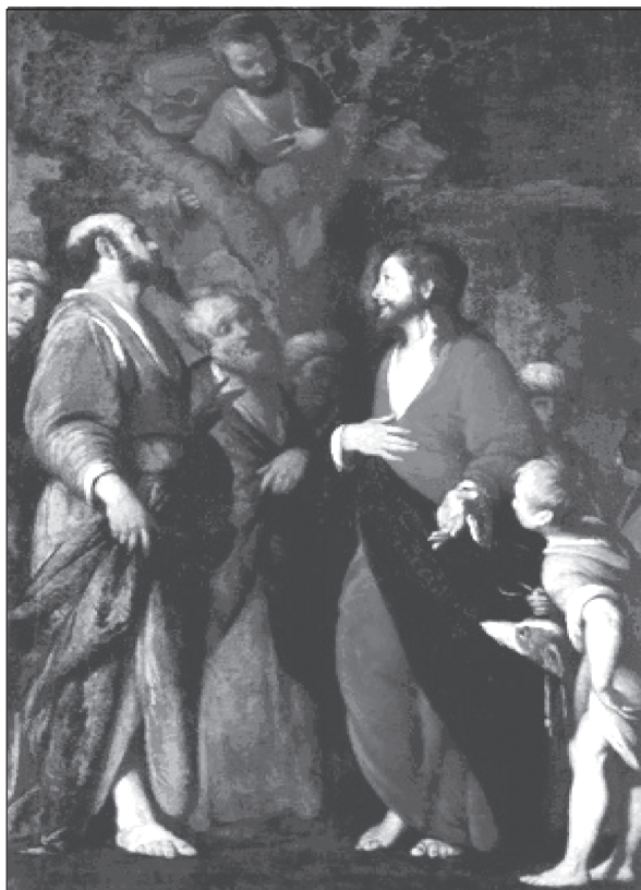
Gesù e Zaccheo